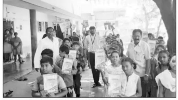
విద్యార్థులకు పుస్తకాలు పంపిణీ చేస్తున్న ఎన్ఎస్ఎస్ విభాగం

ఒంగోలునగరం, మార్చి 11 (ప్రభన్యూస్) స్థానిక వల్లూరు సమీపంలోని రైజ్ కృష్ణసాయి ప్రకాశం గ్రూప్ ఎన్ఎస్ఎస్ విభాగం వారు గత 7 రోజులుగా జరుగు తున్న సేవా కార్యక్రమాలు బుధవారం ముగిసాయి. అని ఆఖరి రోజు కార్యక్రమాలలో భాగంగా కొప్పోలు గ్రామం లోని రామకృష్ణ హైస్కూల్ విద్యార్థులకు మొదటి రోజు నిర్వహించిన పోటీలలో విజేతలకు బహుమతులను అందజేశారు. అంతే కాకుండా అక్కడ హాస్టల్లోని పేద