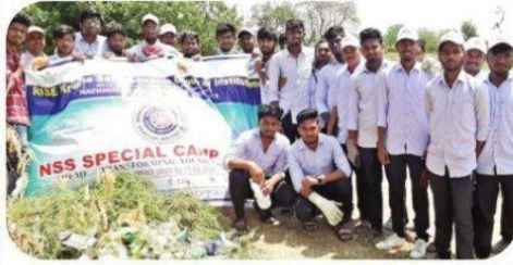
చెరువు పరిసరాలు శుభ్రం చేసిన