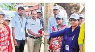
ట్రాఫిక్ సిబ్బందికి గులాబీ పూలు ఇచ్చి అభినందిస్తున్న రైజ్ ఎమ్ఎస్ఎస్ విద్యార్థులు