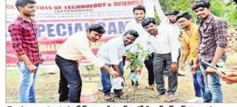
మొక్కలు నాటుతున్న వీన్ ఇంజనీరింగ్ కాలేజీ ఎన్ఎస్ఎస్ విద్యార్థులు