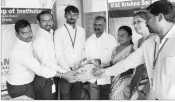
హాస్టల్ విద్యార్థులకు స్టీల్ పళ్లెాలు అందజేస్తున్న ఎన్ఎస్ఎస్ విభాగం