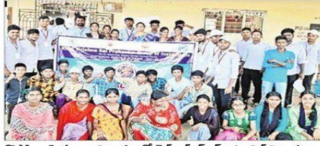
కొప్పాలు హైస్కూలు విద్యార్థులతో రైజ్ ఎన్ఎస్ఎస్ యూనిట్ విద్యార్థులు