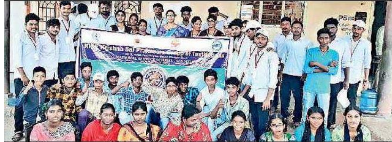
కొప్పోలులో జరిగిన సేవాకార్యక్రమానికి హాజరైన విద్యార్థులు