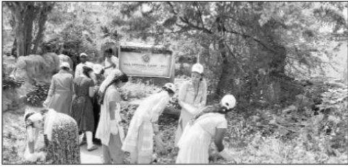
రామకృష్ణ హైస్కూల్లో స్వచ్ఛభారత్ నిర్వహిస్తున్న ఎన్ఎస్ఎస్ విద్యార్థులు