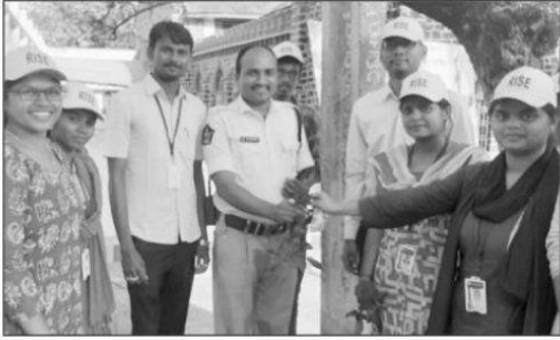
ట్రాఫిక్ కానిస్టేబుల్కు గులాబి పువ్వు అందజేస్తున్న విద్యార్థులు