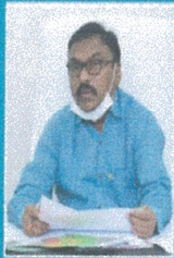
క్రియతులు పోలా భాస్కర్ గారు, ఎ.ఎ.ఎస్. డైరెక్టర్, ప్రకాశం జిల్లా