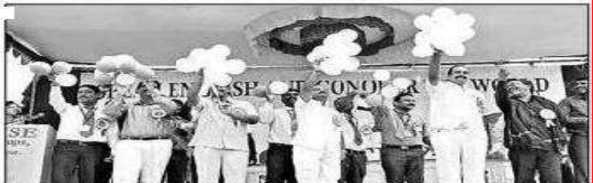
కార్యక్రమంలో పాల్గొన్న కళాశాల ప్రతినిధులు, విద్యార్థులు